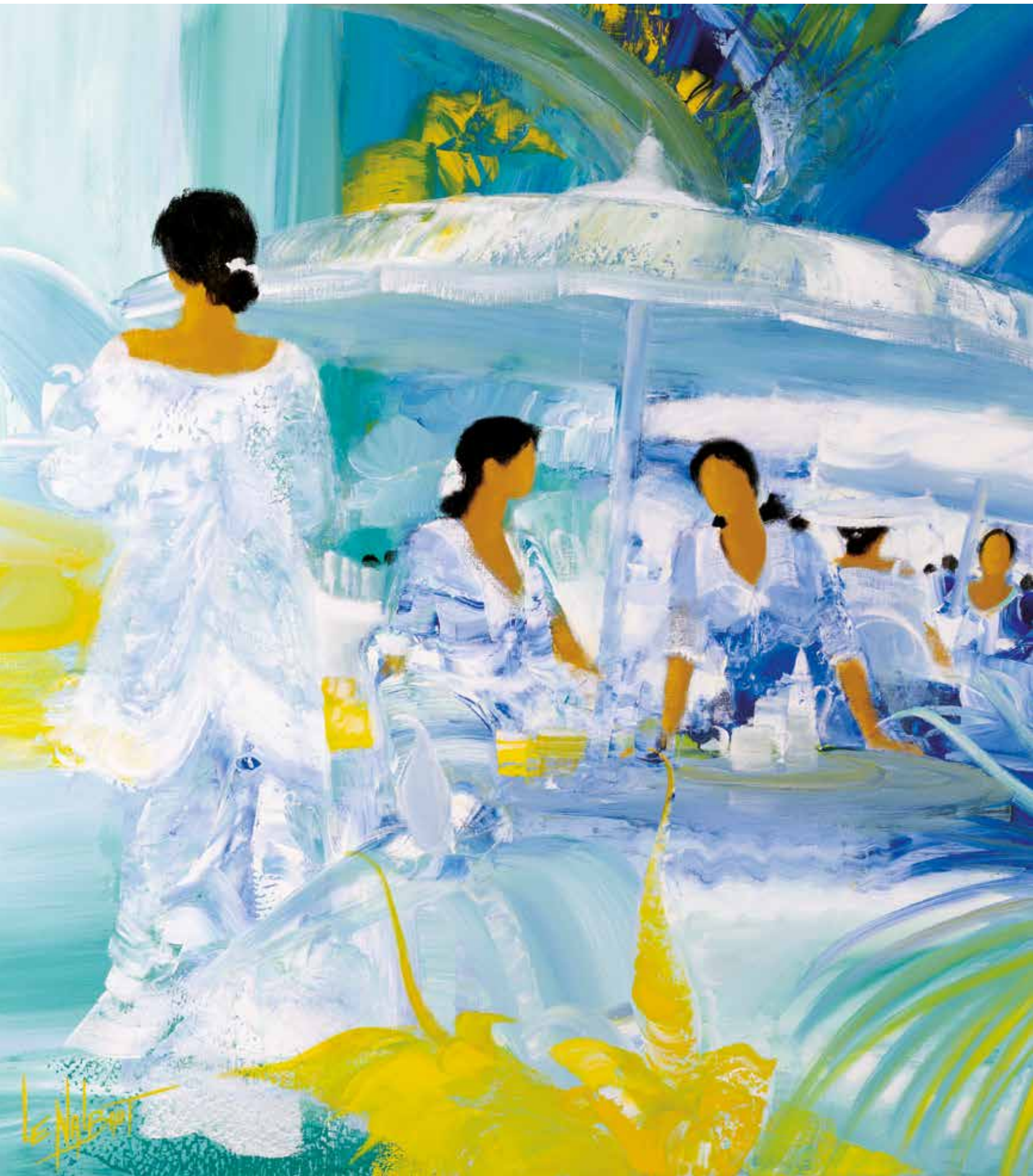
Au bananier bleu - 130x97 cm